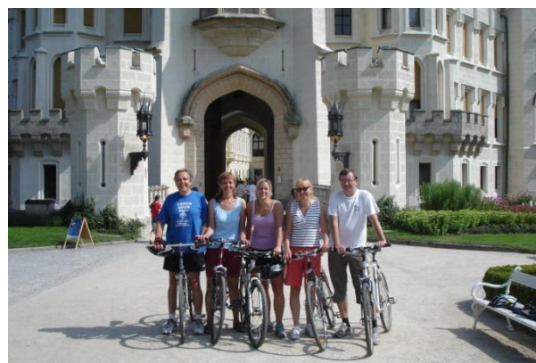
Hluboká opět volá

„Lester Piggot nikdy nevyhrál Derby na formanském valachovi“ řekl.